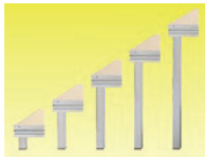
Steckfüße 40 mm. Fixlängen.