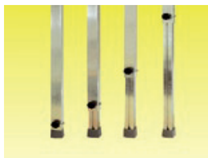
Steckfüße 40 mm. Teleskopierbar.