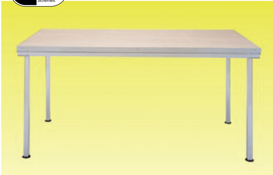
NIVOflex®-Light. Ideal für Sonderhöhen, Sondermaße und Sonderformen.