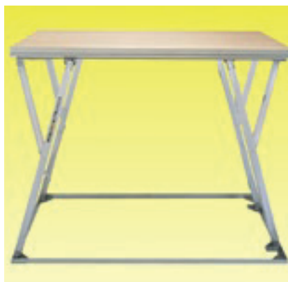
Version NIVOflex®-Elefant für Höhen bis 150 cm.